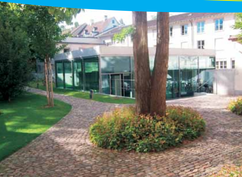
Изглед към университета Schola Cantorum Basiliensis, Швейцария, http://www.scb-basel.ch

„Програмата дава на младите хора от различни държави, етноси, религии и разбирания възможност да живеят и учат заедно, далеч от родния им дом. А това по уникален начин, заедно със срещата с нови мирогледи и чуждестранни знания, подпомага интеграцията им в съвременния свят“